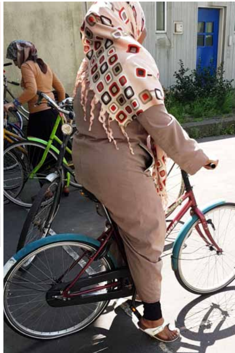
Fietsles. Vooral vrouwen doen hieraan mee.