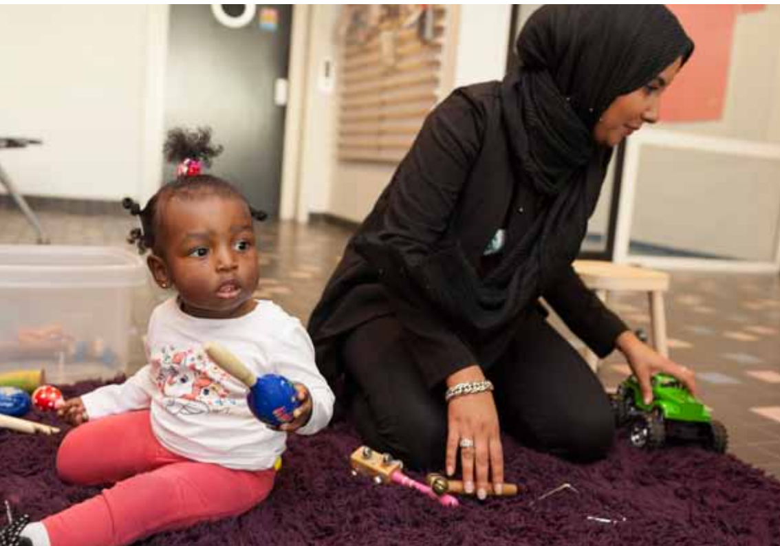
De voorschool: een goede start van de dag en over een paar jaar van de basisschool

Uit welke keuken het gerecht ook komt, eten brengt mensen samen. De gezamenlijke maaltijden zijn voor veel oude en nieuwe Amsterdammers een mooie herinnering.