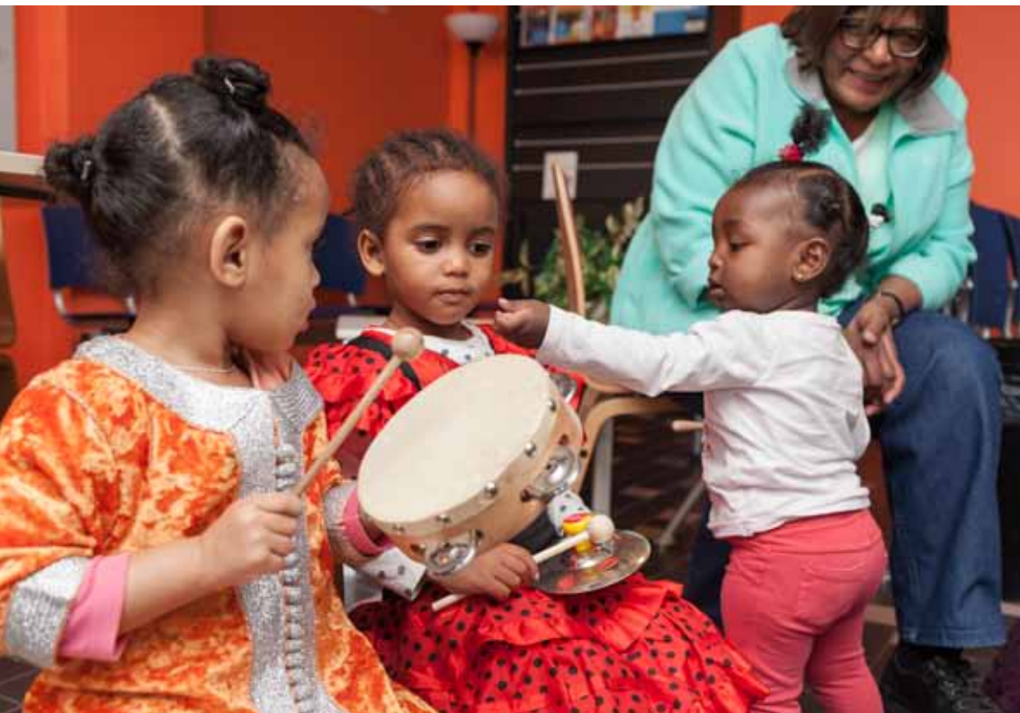
Samen muziek maken op de voorschool