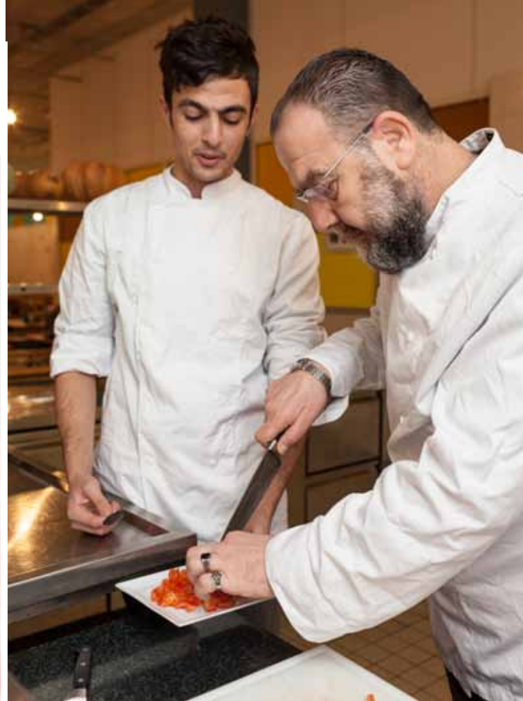
Het loopt storm bij de gezamenlijke maaltijden voor en door vluchtelingen.