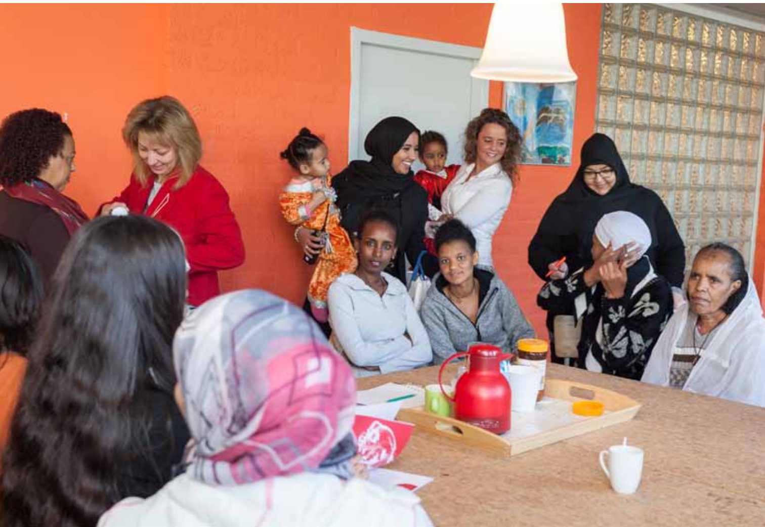
December 2017: De laatste bewoners van AZC Wenkebachweg vertrekken naar andere AZC's of woningen.